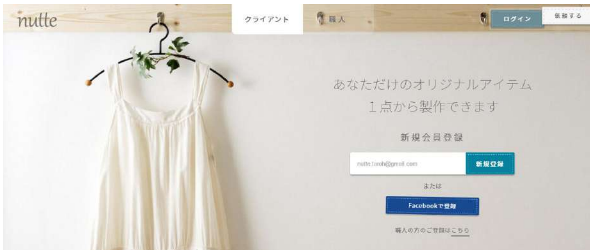
急成長サービス「nutte」を支える凄腕クラウドWebマーケターが気づいた“スタートアップ飛躍の方法”